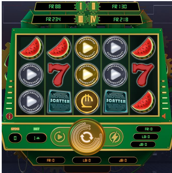
ფოტო N2 - მომგებიანი სიმბოლოები