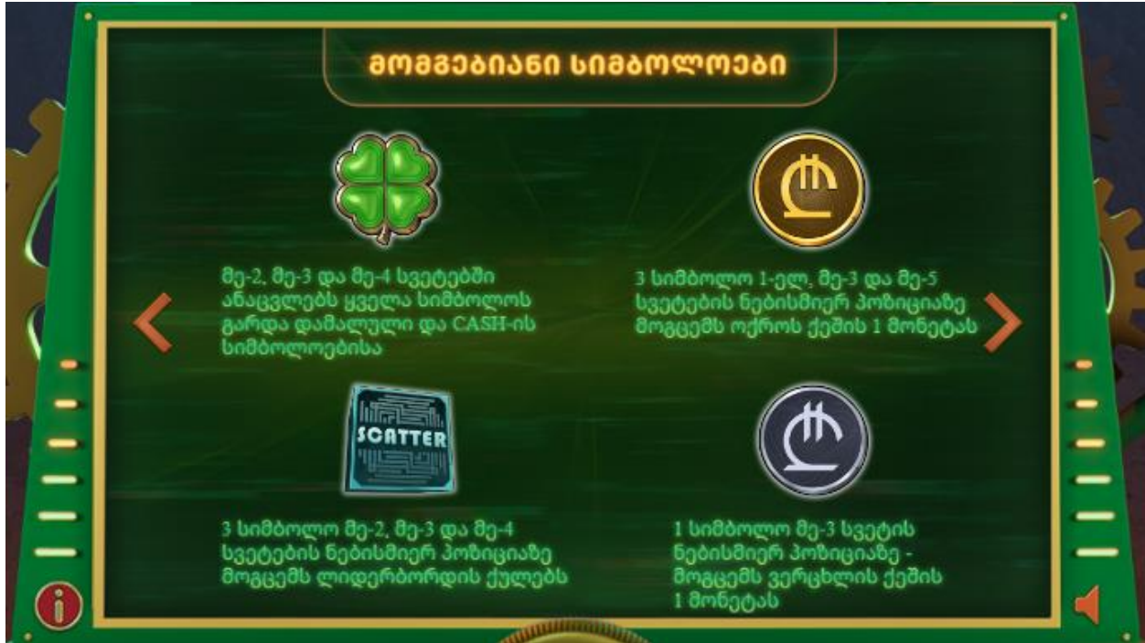
ფოტო N4 - მომგებიანი სიმბოლოები